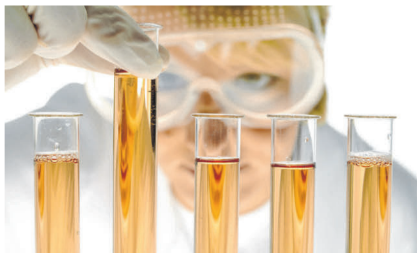
Auslöser von immer mehr Krankheiten können dank der Wissenschaft entschlüsselt und daraus entsprechende Therapien abgeleitet werden.

Die ETH-Forschenden haben in der Rückenmarksflüssigkeit von jeweils 50 gesunden und 50 an Parkinson erkrankten Menschen mehrere Proteine gefunden, deren Formen sich bei gesunden und kranken Personen unterscheiden. Die Proteinformen könnten künftig als neue Kategorie von Biomarkern für Parkinson genutzt werden. In einem nächsten Schritt müssten nun die gefundenen Marker anhand von größeren Patientengruppen eingehend getestet und überprüft werden. Für klinische Diagnosen sei es noch zu früh. Aber beim aktuellen